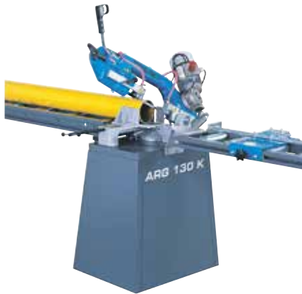
20874-0209 Veltņu transportieris neietilpst

Pilous. Rokas lentzāģis ar strāvas padevi. Piegādā ar garuma atduri. Zāģa loku var ātri iestatīt zāģēšanai 45 grādu leņķī un nobloķēt mehāniski. Zāģa loka aizsargpārsegs ir aprīkots ar drošības slēdzi. Zāģa asmeni vada ar cietmetāla plāksnes un lodīšu gultņu palīdzību.