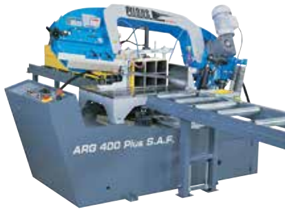
20875-0208 Veltņu transportieris neietilpst

Pilous. Pusautomātiskais lentzāģis. Piegādā ar garuma atduri. Pusautomātu piegādā ar hidrauliskajām skrūvspīlēm un tam ir bezpakāpju lentes ātruma regulators no 15 līdz 90 m/min. Zāģa loku var ātri iestatīt zāģēšanai stāvoklī no 45° pa kreisi līdz pat 60° pa labi attiecībā pret mehānismu un nobloķēt mehāniski. Zāģa loka aizsargpārsegs ir aprīkots ar drošības slēdzi. Zāģa asmeni vada ar cietmetāla plāksnes un lodīšu gultņu palīdzību.